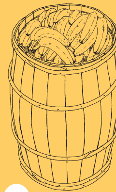
Bananer fra Asien