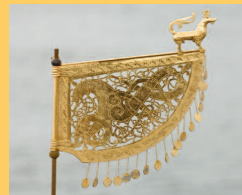
Her kan du se en vindfløj. Den sidder i skibets stævn og bruges til at vise, hvorfra vinden blæser.