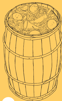
Drikkeglas fra Europa