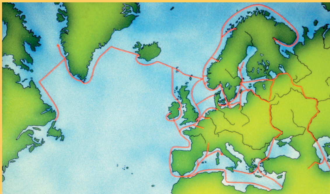
Kortet viser, hvor langt vikingerne nåede ud i verden.

De besøgte store dele af verden. De mødte også fremmede handelsfolk fra lande, de aldrig selv rejste til. Derfor kendte vikingerne til silke fra det fjerne Kina.