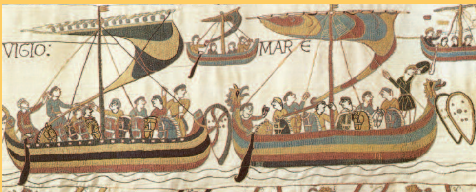
Vikingerens krigsskibe kan bl.a. ses på det håndsyede Bayeux-tapet.

Sejl med røde og grønne striber, farlige dragehoveder i træ og skjolde i et væld af farver. Det var sådan et syn, der mødte folk, når vikingerne angreb. Et virvar af farver og uhyggelige drager, der skulle gøre folk bange. For når vikingerne tog af sted i deres krigsskibe, var det for at plyndre, stjæle eller kæmpe. Og det var meget nemmere, hvis folk var bange for dem.