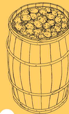
Kartofler fra Sydamerika