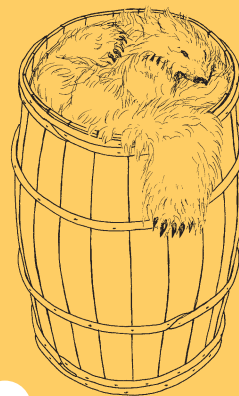
Isbjørneskind fra Grønland