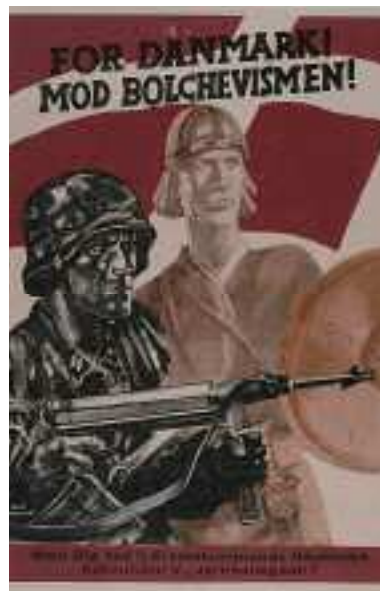
En plakat fra 1944 udgivet af SS-Ersatzkommando Dänemark. For nazisterne var vikingerne historien om de nordiske folk, der drog ud i verden og vandt over andre racer.