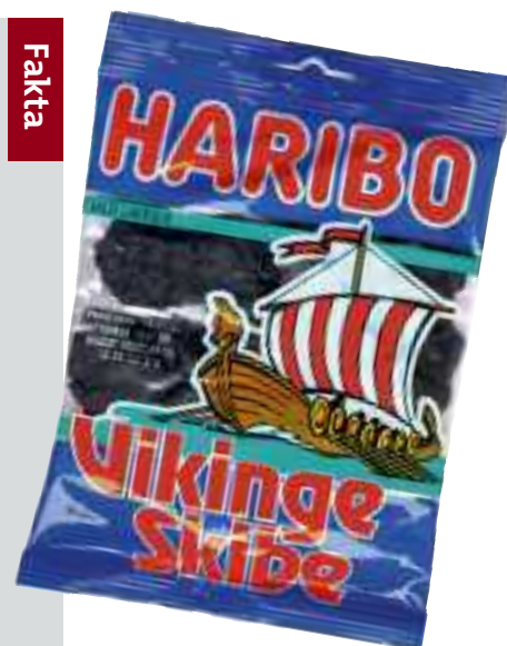
Vikingeskibe kan også spises.

De fleste tror, at vikingehjelmene havde horn. Det passer bare ikke. Idéen opstod, da man begyndte at male billeder af vikingerne, men ikke havde så meget viden. Så måtte kunstnerne selv opfinde vikingens udseende.