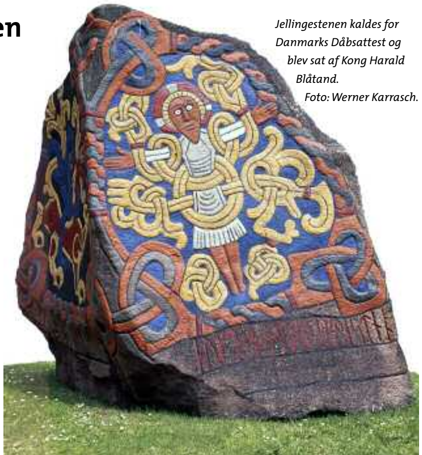
Jellingestenen kaldes for Danmarks Dåbsattest og blev sat af Kong Harald Blåtand.