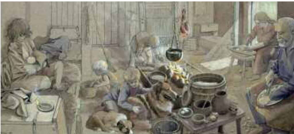
Boligen var den nære fysiske ramme om livet. Midterrummet med vægbænke og et forhøjet ildsted var kombineret køkken- og opholdsrum. Tegning: Flemming Bau.

Den arabiske forfatter og opdagelsesrejsende Ibn Fadlan fandt vikingerne urene: