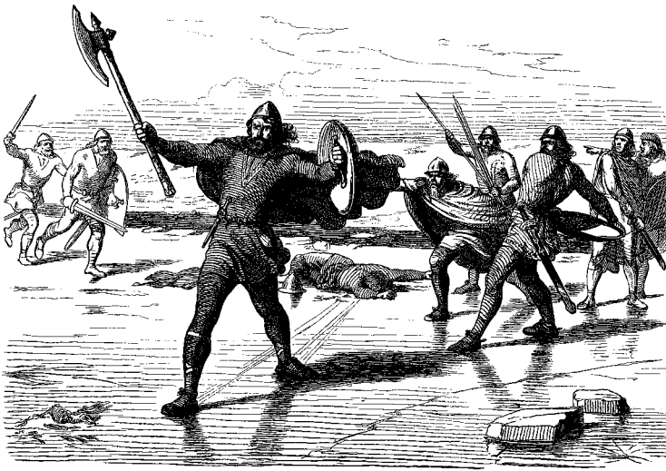
Viking anno 1875. Kunstneren Otto Bache har ønsket at vise vikingetiden som en periode med dramatik og handling. Han har også ønsket at vise vikingetidens mennesker som nordiske.

Under 2. verdenskrig blev vikingerne og deres symboler igen brugt flittigt. Både af tyskerne og danskerne. De tyske nazister så vikingerne som forfædre til de nord-europæiske folk. Nazisterne syntes, at disse mennesker var mere værd end andre mennesker.