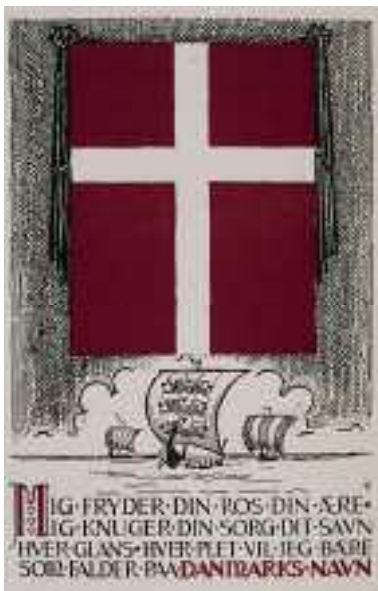
Postkortet er udgivet af Dansk Samling i 1940. Under 2. verdenskrig blev vikingerne et positivt symbol.

Efter 2. verdenskrig kom idéen om den „hyggelige“ viking, som nok er bedst kendt i dag. Figuren passer godt til den danske selvforståelse af den hyggelige, øldrikkende kolonihavedanser. Vikingefiguren blev nu også brugt i satire, f.eks. af politikere, og den blev almindelig i børnebøger. Tegneserien „Valhalla“ er blevet meget kendt – også som tegnefilm.