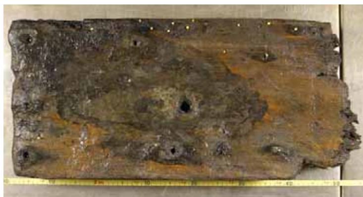
Figur 3: Bordplanke X2; ydersiden med kobberforhudningens spigerhuller markeret med gule kortnåle.

Det aflange ”rev”, hvor kanonen blev fundet, består af blåler og alt muligt affald. Det er tydeligvis dannet ved klappning af opgrabbet materiale. Det er nærliggende at forestille sig, at dette materiale, og dermed kanonen og planken, stammer fra den nærliggende Gilleleje Havn, hvilket muligvis vil kunne påvises gennem arkivalske studier.