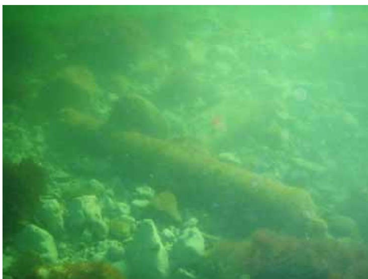
Figur 1: Kanonen og plankefragmentet med "revet" i baggrunden.

Findestedet ligger lige øst for Gilleleje Havn på ca. 2 meters dybde. I området findes flere aflange "rev" dannet ved klappning af opgrabbet materiale. I udkanten af et af disse lå kanonen frit eksponeret og liggende delvist ovenpå et fragment af en skibsplanke af bøg fra et kraelbygget, kobberforhudet skib. "Revene" består af blåligt undergrundsler i klumper blandet med alt muligt affald; tegl, sten, tømmer og jerndelev. Den omgivende havbund består derimod af rent sand.