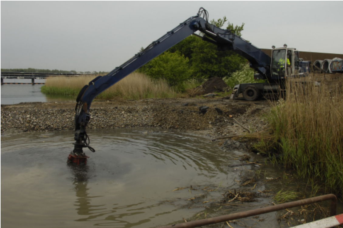
Figur 3: Arbejdsområdet i vigen på vestsiden af Markedsgade.