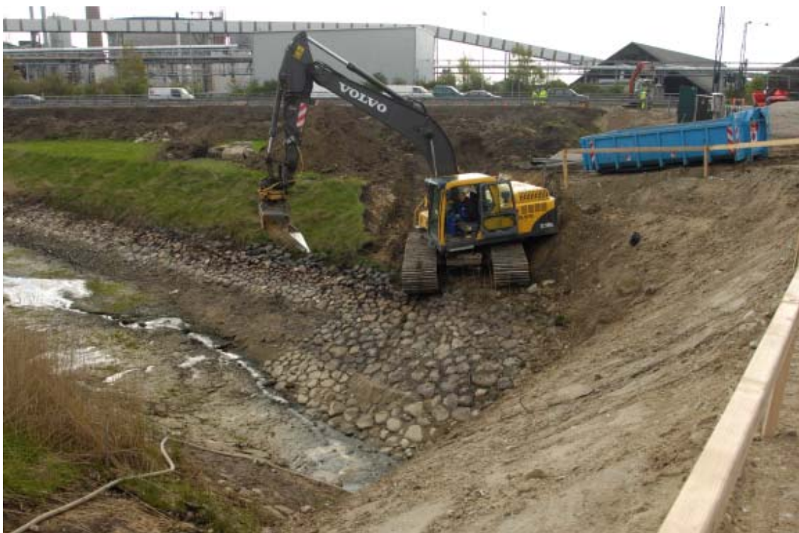
Figur 2: Arbejdsområdet i kanalen på østsiden af Markedsgade.

Den berørte lokalitet udgøres dels af et lille parti af Sukkerfabrikkens kanal på østsiden af Markedsgade (Figur 2), dels af en del af den lille vig af Guldborgsund på vestsiden af vejen (Figur 3).