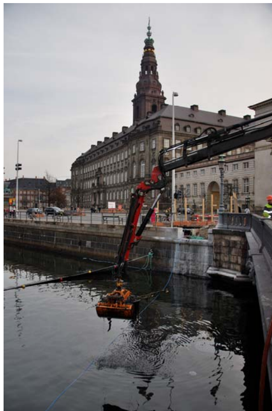
Figur 3: Opgravning langs markeringsline i tracé. I baggrunden siltgardin.

Da alt arbejde i havbunden på grund af forureningsrisiko skulle foregå bag et siltgardin, som på grund af turistfarten gennem kanalen ikke måtte være monteret længere tid en højst nødvendigt, ansås det ikke for realistisk at udføre undersøgelsen som en egentlig forundersøgelse. I stedet valgtes en fremgangsmåde, hvor både prøvegrabning og den egentlige opgravning blev overvåget af Vikingeskibsmuseet og det opgravede materiale gennemset, og stedvist soldet, med henblik på opsamling af genstande. Herved sikredes muligheden for at standse eller forlægge arbejdet ved forekomst af faste anlæg samt et repræsentativt udsnit af genstande til belysning af aflejringsforholdene i kanalen. Materialet blev gennemset i en container, hvori museets sold var anbragt. Containeren var opstillet enten på terræn eller på lastbil; i sidstnævnte tilfælde udstyret med faldsikring. Heri blev materialet aflæsset - enten i containerens bund eller i soldet alt efter museets vurdering (for eksempel ved de ovennævnte forekomster af mere rent sand) - og gennemspulet, hvorved genstandene kunne ses og opsamles. Genstandene blev under opsamlingen sorteret ud i spande nummereret efter meter-afsnit på målelinjen. Opdelingen er dog kun vejledende, idet grabben ikke blev spulet ren efter hver grabning. Således findes sammenhørende skår i forskellige meter-afsnit. Disse er registreret under det først gravede afsnit.