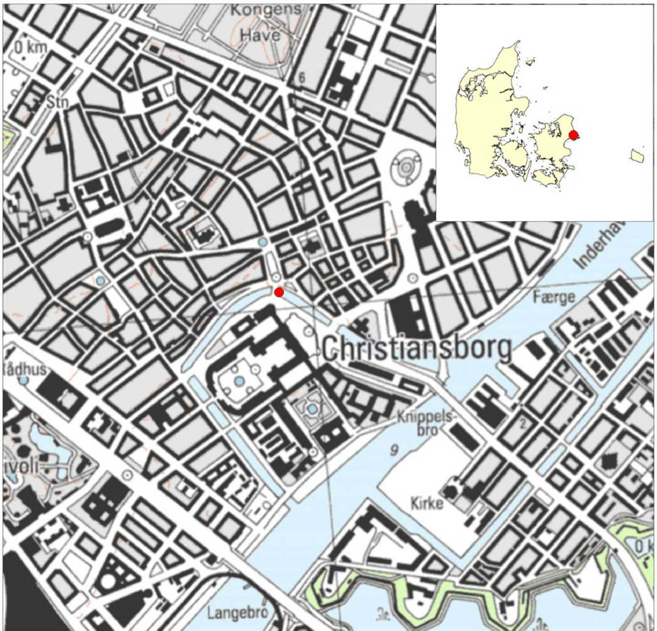
Figur 1: Oversigtskort.

I samråd med Københavns Energi A/S og dennes entreprenør, Aarsleff-Kamco JV, blev det på grund af logistiske forhold besluttet at udføre undersøgelsen som overvågning af gravearbejdet.